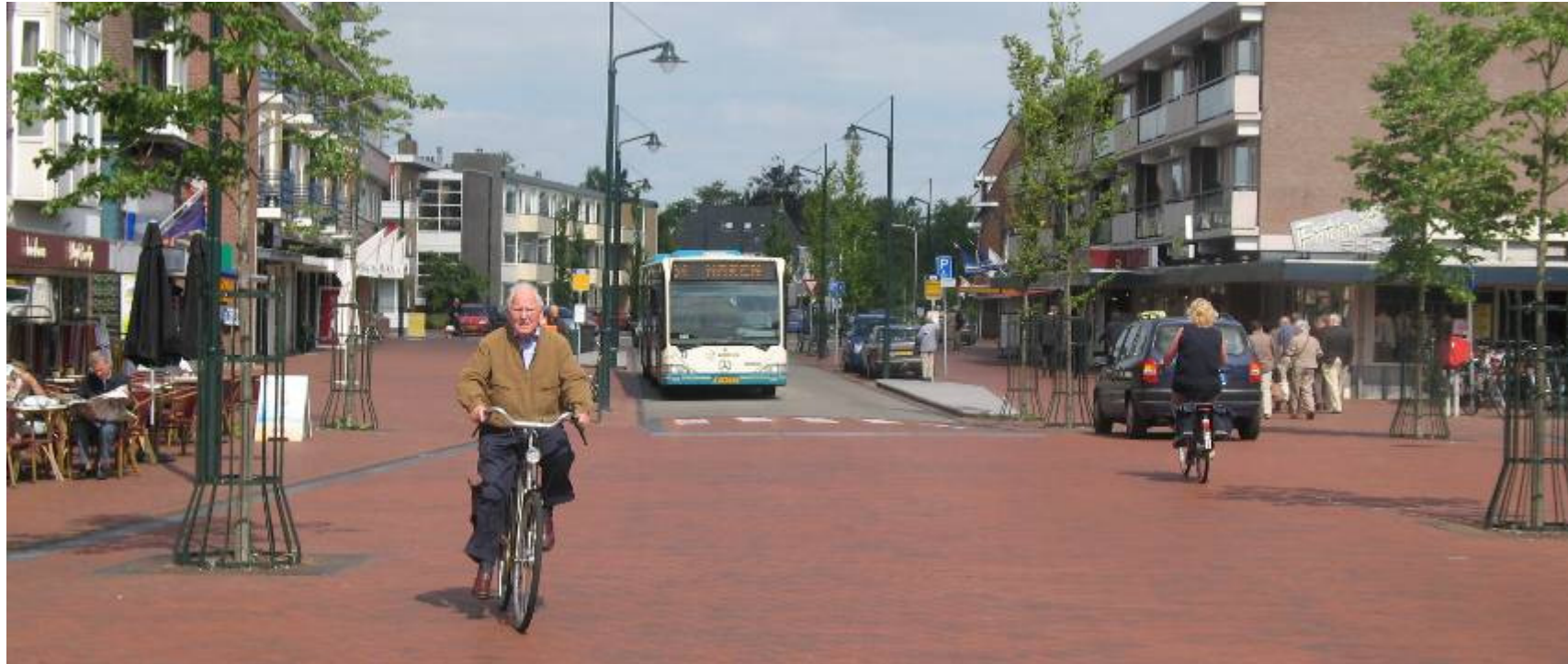
Rijksstraatweg, Haren, NL