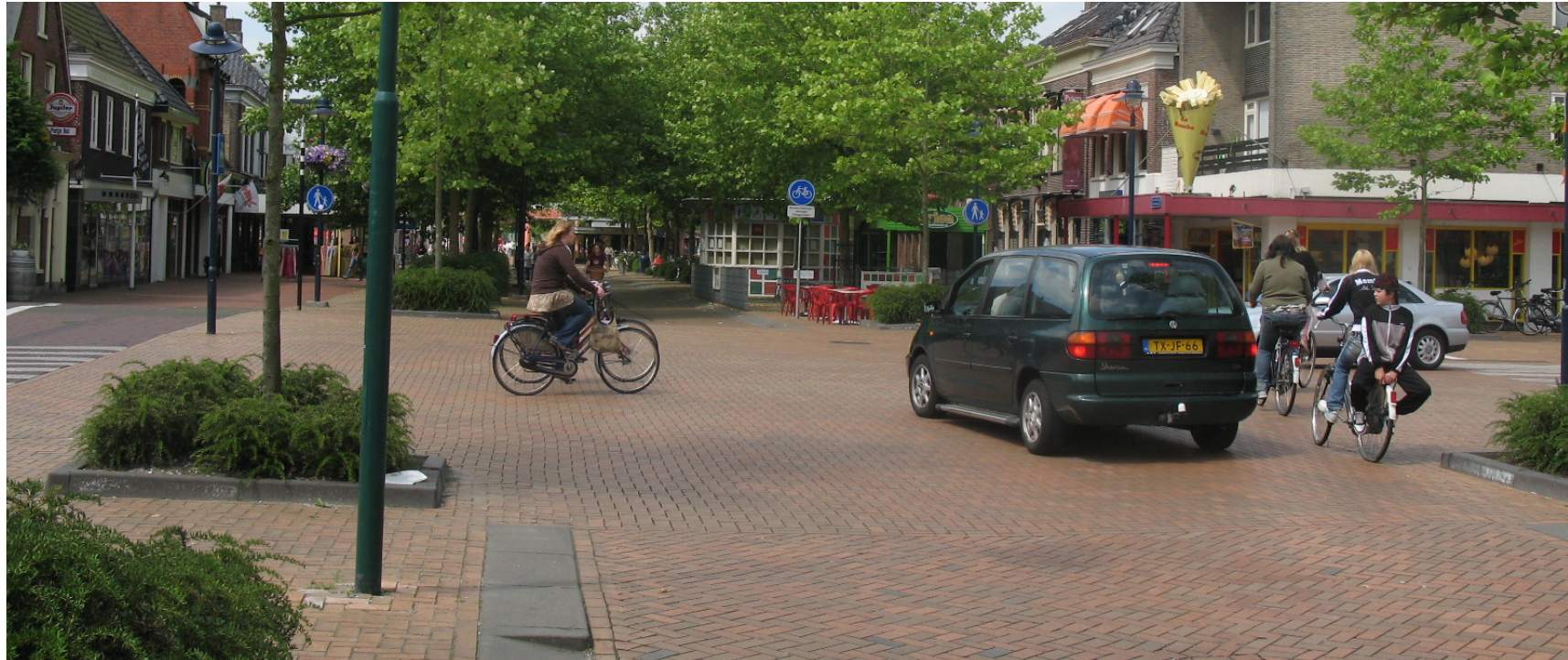
Knotenpunkt De Drift/Torenstraat/Kaden, Drachten, NL