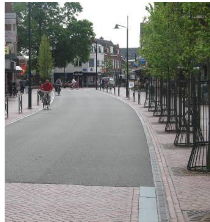
Rijksstraatweg, Haren, NL