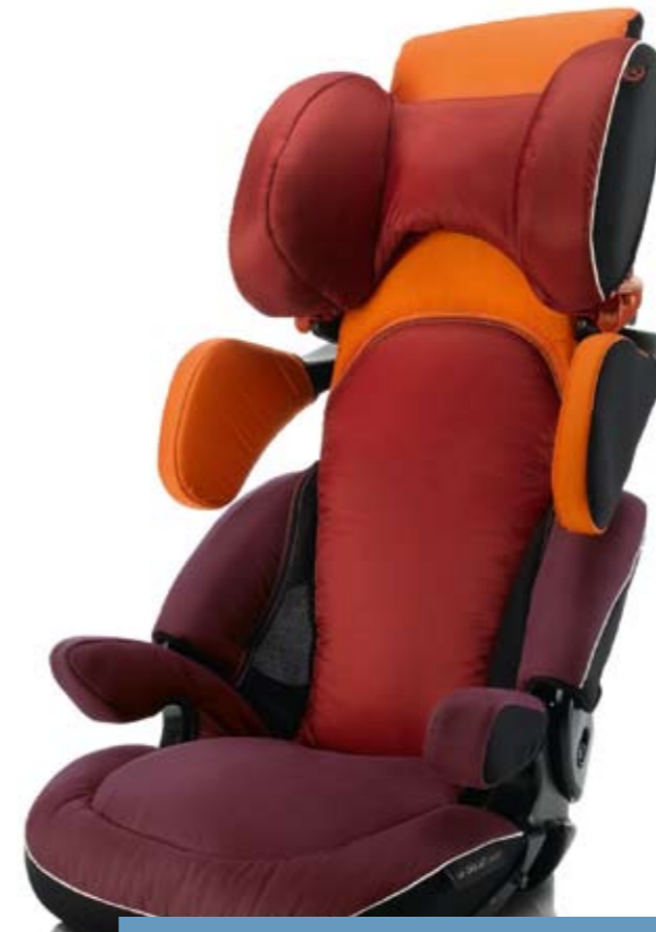
15 - 36 kg arası için

Çocuğunuz bir önceki koltuğun ağırlık sınırı olan 18 kiloya ulaştığında, uyku esnasında baş koruma yastıkları olan veya olmayan yükseltici koltuk veya minder sistemlerine geçebilirsiniz.