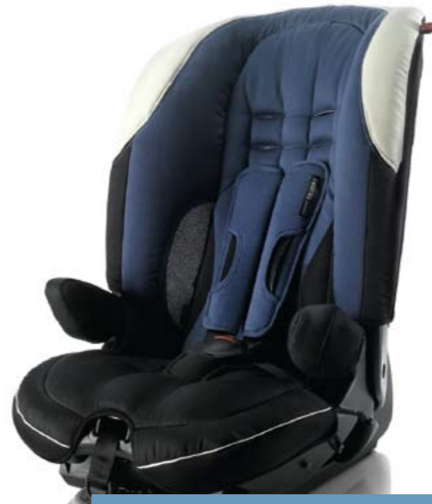
9 - 18 kg arası için

ISOFIX koltuklarının montajı emniyetli oluyor. Araç ya da koltuk alırken ISOFIX bağlantılarına dikkat ediniz.