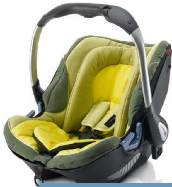
0 - 13 kg arası için

Lütfen standartlara uygun, kalitesi yüksek bebek koltuklarını tercih ediniz. Bebek koltuğunun montajından önce, üreticinin sunduğu kullanım kılavuzunu mutlaka dikkatlice okuyunuz.