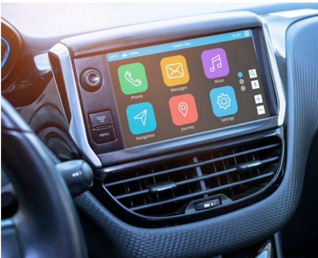
Abbildung 4: Integration in die Infotainment-Infrastruktur/Dashboard

phone mitgenutzt werden. Mit dem Aufkommen elaborierter Spracherkennungs- und -produktionssoftware sind darüber hinaus auch für die Kommunikationsgeräte selbst immer häufiger Vorlesefunktionen verfügbar. Diese können Bildschirmhalte und vor allem Nachrichten vorlesen und damit den Bedarf an Blickabwendungen minimieren. Möglicherweise wird durch die benutzerfreundlichere Bedienung aber auch ein zusätzlicher Anreiz geboten, häufiger als zuvor der kommunikativen Nebentätigkeit während der Fahrt nachzugehen. Gerade die Vorlesefunktion und die Integration des Smartphones in die bordinterne Infrastruktur können aber durch die Minimierung der visuellen Ablenkung sehr hilfreich sein.