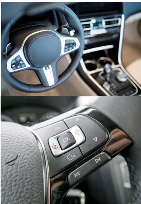
Abbildung 3: Multifunktionslenkrad

ausreichend verschiedenartigen Gesten begrenzt. Damit ist der Einsatz für die Gestensteuerung stark eingeschränkt.