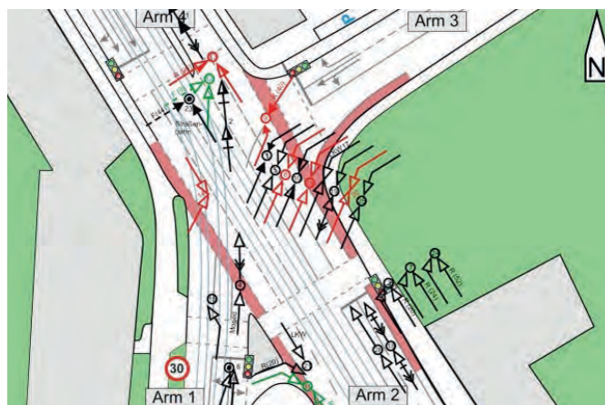
Fehlende und abgefahrene Markierung einer LSA-Kreuzung ohne Linksabbiegerschutz und dazugehöriges Unfalldiagramm