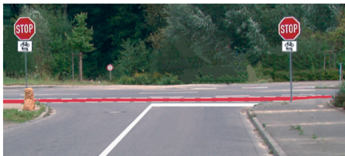
Eingefärbter Radweg: Kostengünstige und wirksame Maßnahme

Im Jahr 2010 hat die Unfallforschung der Versicherer (UDV) eine Untersuchung zum Status Quo der Unfallkommissionen in Deutschland durchgeführt. Diese Studie zeigte, dass in fast allen Bundesländern die Umsetzung von wirksamen Abhilfemaßnahmen an Unfallhäufungen oftmals an deren Ko-